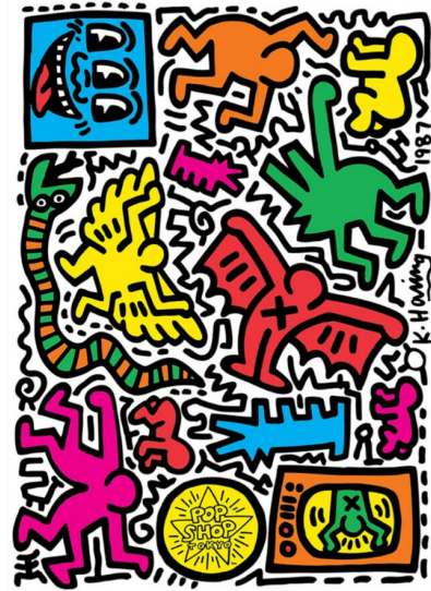
Pop art van de bekende Keith Haring.